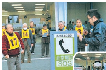
シルバードライバー教室 高速道路での措置要領