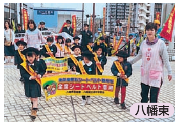
みんなでシートベルトをしましょうね