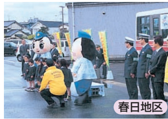
交通安全街頭活動出発式