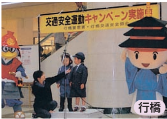
ゆるキャラと一緒に交通安全宣言