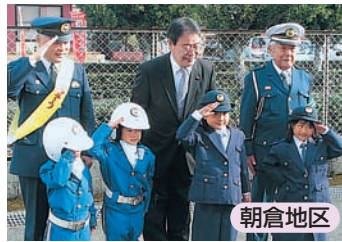
安全運転よろしくお祈りします