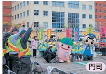
交通安全区民大会