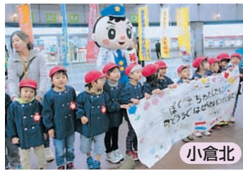
交通安全のお約束