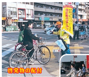
密着物の配付 横断歩道は 押しチャリで