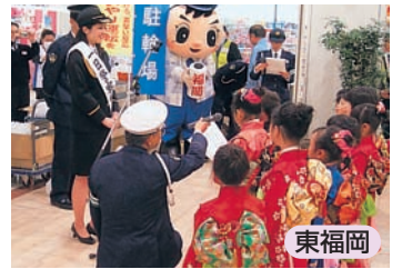
宣言文を一日警察署長に