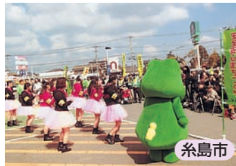
地元アイドルグループも参加