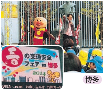
アンパンマンと一緒に