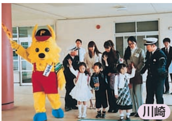
右見て左見て もう一度右見て