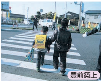
新入学児童の保護誘導