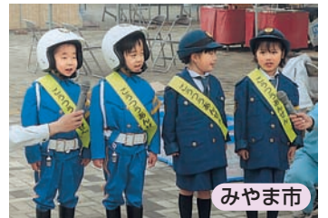
保育園児による交通安全宣言