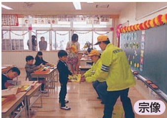
新入学児童へのランドセルカバーの贈呈