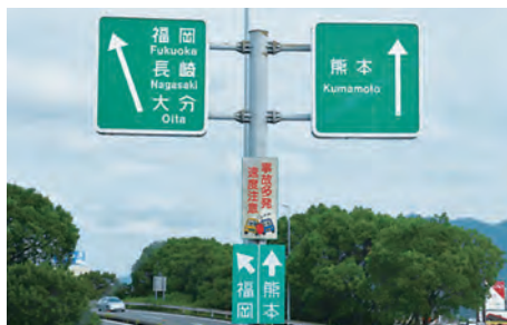
方面及び方向 (どちらの方向に進むべきか確認)