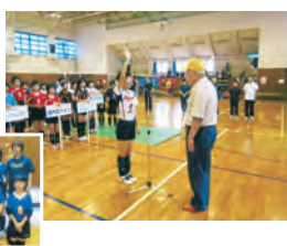
小学生バレーボール大会の後援 ～門司交通安全協会長杯～