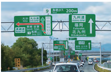
方面及び車線 (自分の進む車線を把握)