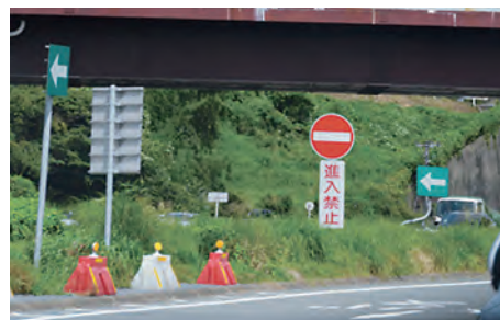
SA・PA での進入禁止 (入口側に侵入しない!)