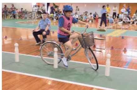
ジグザグ走行(福岡・筑後ブロック)