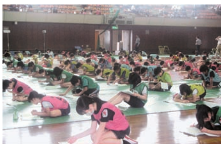
学科試験(北九州・筑豊ブロック)