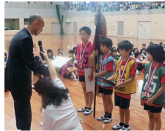
団体優勝の小森野小学校Aチーム