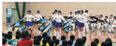
警察音楽隊の演奏