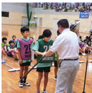
団体優勝の小森野小学校Aチーム

なお、団体優勝の久留米市立小森野小学校Aチームは、8月5日(水)東京ビックサイト(有明)での「第50回交通安全子供自転車全国大会」に県代表として出場しました。