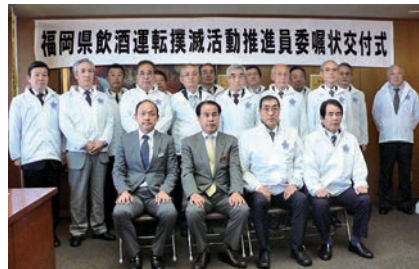
委嘱を受けた飲酒運転撲滅活動推進員