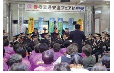
県警音楽隊の演奏