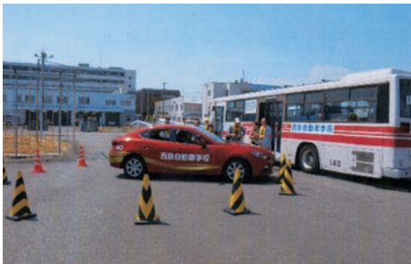
「シルバードライバー教室」(西鉄自動車学校) 運転が自己流になっていました