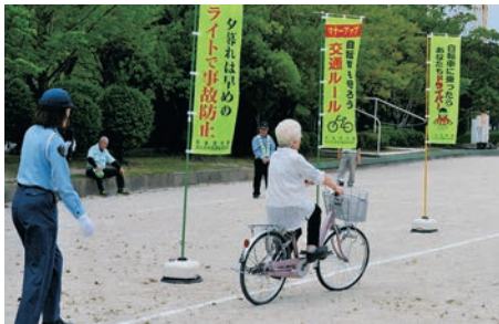
「高齢者の自転車教室」 車道は左側通行ですね