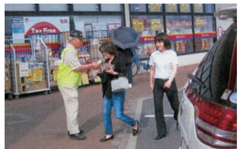
「飲酒運転撲滅の日」 まずは家庭から…と呼びかけています