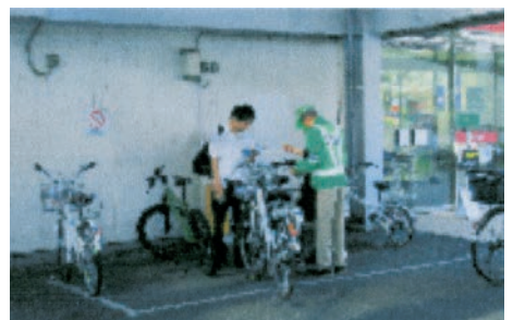
「自転車街頭指導」 駐輪マナーも指導します