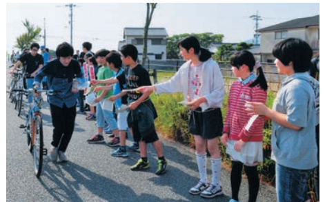
「メッセージカード手渡し作戦」(元岡小学校) 私たちから交通安全の願いを込めて