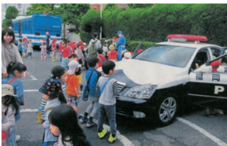
「警察署訪問時の交通教室」 僕もパトカーのおまわりさんになりたい