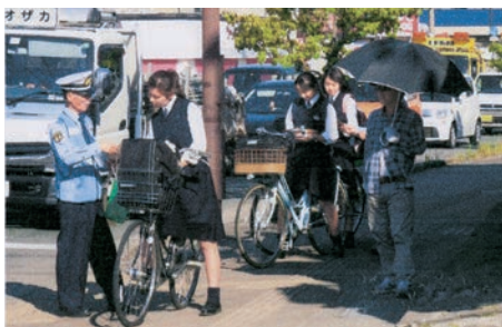
「街頭キャンペーン」 自転車通学生を対象に安全利用を指導