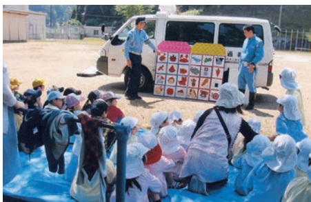
「交通教室」 交通安全クイズで楽しくルールを勉強