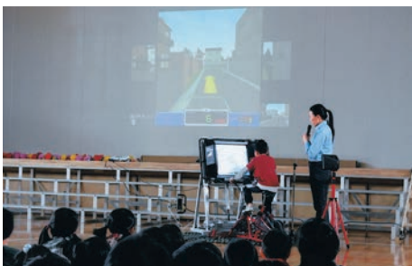
「自転車教室」(ひびき小学校) 初体験の自転車シミュレーション