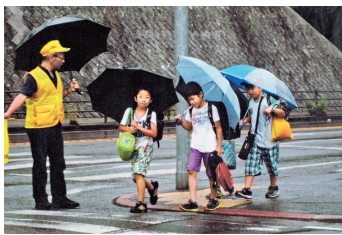
保護誘導活動 雨の日は特に注意して