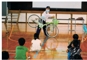
自転車教室(山口小学校) ブレーキのかけ方について勉強