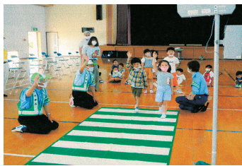
交通安全教室(小竹南小学校) 上手にできるかな