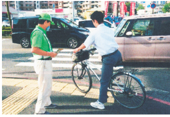
街頭キャンペーン 自転車利用者のマナーアップのために