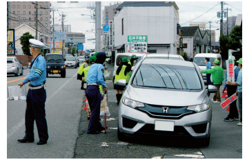
セーフティステーション 役割分担でスマートに実施