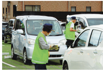
セーフティステーション 駐車場にも足を運んで