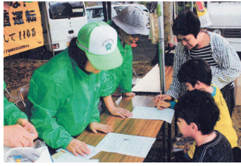
キャンペーン 自転車安全クイズに挑戦