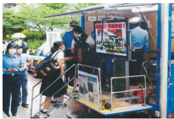
ミニキャンペーン(春日高校) 高校に向いて交通安全をアピール