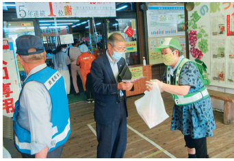
キャンペーン マスクをして交通安全の声掛け