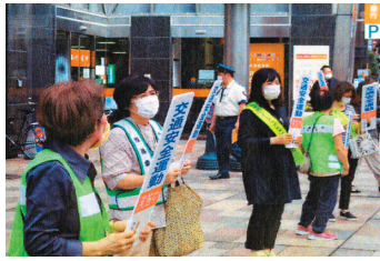
街頭キャンペーン ハンドプレートが広報力を発揮