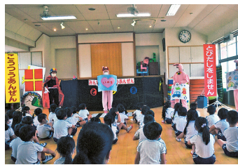
交通安全教室(済世第一幼稚園) 幼児教育班による楽しい指導