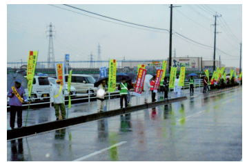
街頭活動 雨が降っても交通安全のために