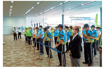
飲酒運転撲滅キャンペーン ソーシャルディスタンスに配慮して集合