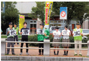
飲酒運転撲滅キャンペーン 参加代表者によるメッセージ