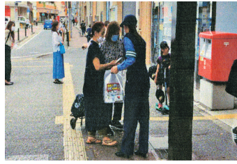
あおり運転厳罰化キャンペーン 6月30日の施行日に