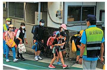
保護誘導活動 子供たちを笑顔で見守り