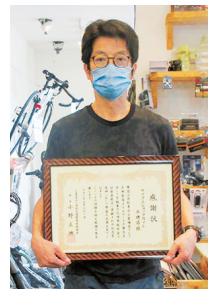
前年度に続く受賞

(公財)日本交通管理技術協会から、TSマークの貼付推進が優秀であったとして「サイクルショップカイト干隈店」に感謝状と副賞が贈呈されました。