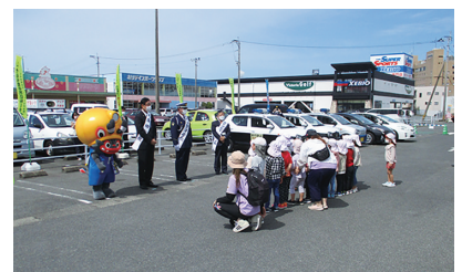
交通安全キャンペーン ジャー坊と一緒に交通安全