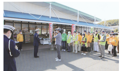
セーフティステーション お揃いの帽子とベストで参加