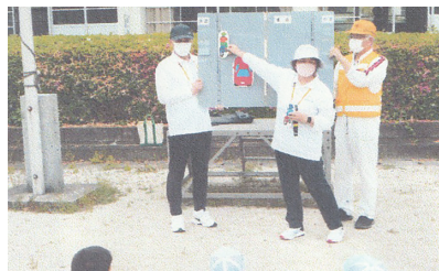
自転車教室 県安協教育班とともに