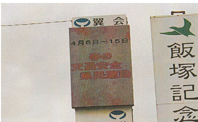
民間電光掲示板活用広報活動 交通安全に民間協力は不可欠です