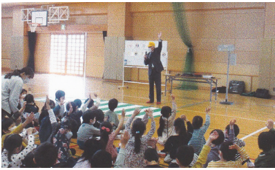
新一年生交通教室（清水小学校） 元気一杯手を挙げて