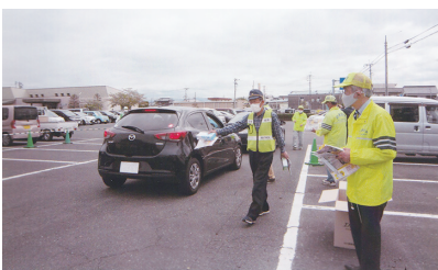
セーフティステーション 的確な役割分担でスマートに