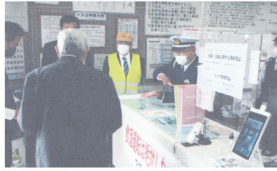
飲酒チェック共同立会 飲酒運転ゼロを目指して