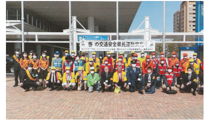
交通安全キャンペーン 官民一体での啓発活動