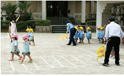
交通教室 僕も私も元気よく