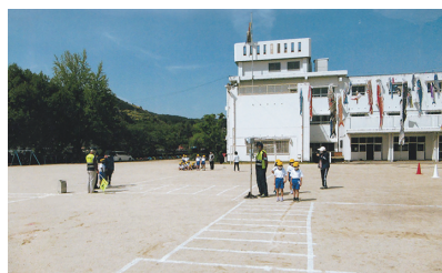
交通教室 鯉のぼりも見守ってます