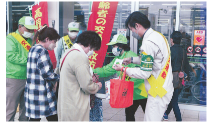
高齢者交通事故防止キャンペーン 反射材が効果的です