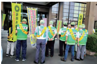
交通安全啓発キャンペーン 皆さん、準備はいいですか?