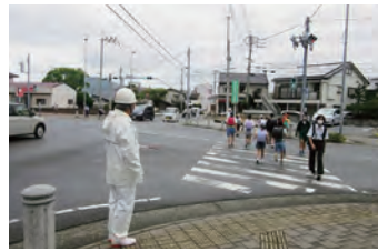
保護誘導活動 子どもの安全のためなら、雨にも負けず