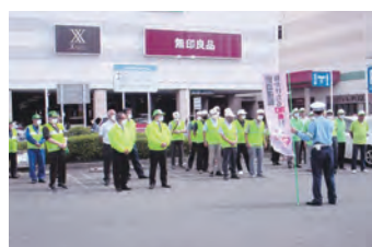
交通安全啓発キャンペーン 思いは一つ、役割分担を発表します