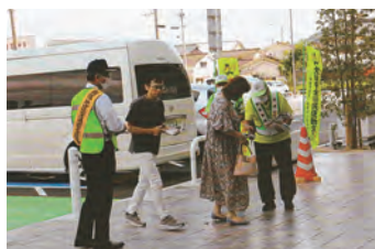
交通安全啓発キャンペーン 啓発物に笑顔を添えて…