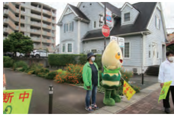
保護誘導活動 JA「ちくしんぼー」も頑張りました