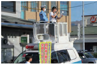
自転車マナーアップキャンペーン DJ 女子高生、広報活動実施中!