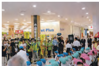
交通安全啓発キャンペーン 声を揃えて、元気よく参加しました