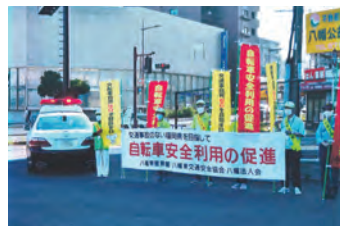
自転車安全利用促進キャンペーン ルールを守り、マナー向上にご協力を