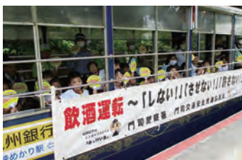
飲酒運転撲滅キャンペーン 僕達、私達からお願いします