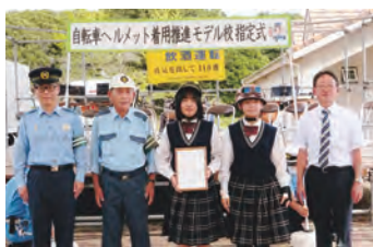
自転車ヘルメット着用推進モデル校指定式 皆さん、私達が模範を示します