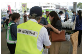
交通安全啓発キャンペーン 熱意をもった声掛けに応えてくれました