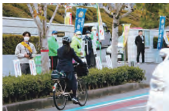
自転車通学生安全指導 さすがモデル校! ルールを守っています