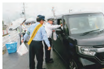
交通安全啓発キャンペーン 雨天です、安全運転をお願いします