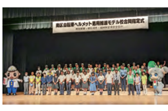
自転車ヘルメット着用推進モデル校指定式 7校合同の指定式…ヘルメットを着用します