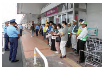
交通安全啓発キャンペーン 交通事故防止、皆さんの活動が大切です