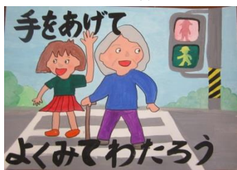
小・中学生交通安全 図画作文コンクール