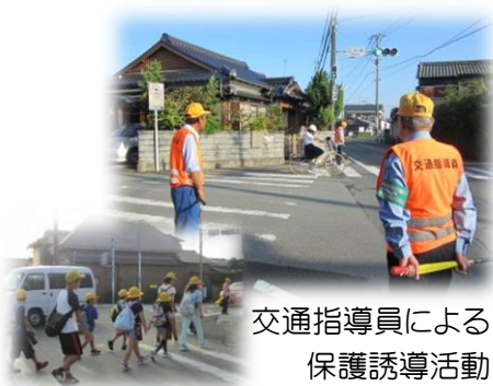
街頭交通安全活動