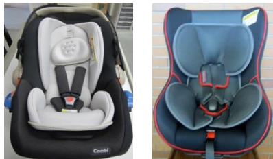
チャイルドシート 無償貸出し(会員限定)