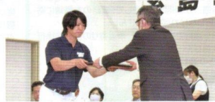
表彰を受ける事業者

例年、定期総会場で表彰を行っています「交通事故防止コンクール優良事業所」は次のとおりです。受賞事業所の皆様おめでとうございます。これからも無事故で安全運転をお願いします。